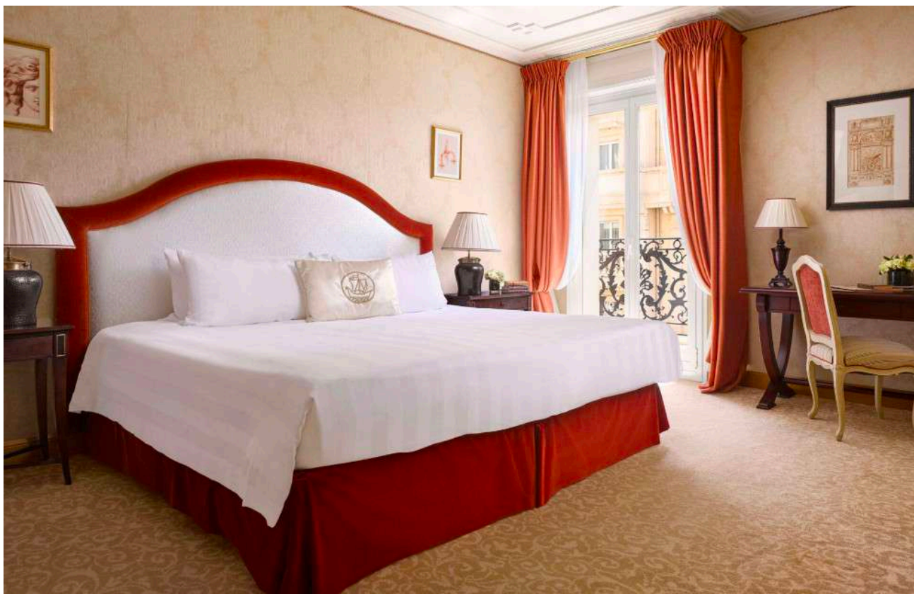
Hôtel Metropole Monte-Carloのスーパーリアルーム

6:00 p.m.-7:00 p.m. Hôtel Metropole Monte-Carloのロビー・バーでウェルカムドリンクを