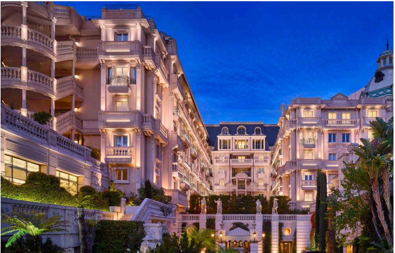
Hôtel Metropole Monte-Carlo - モンテカルロ中心部の5つ星デラックスホテル

ニース国際空港到着後、手荷物受取所でドライバーがお客様のお名前を書いた看板を持ってお迎えます。お荷物をお預かりしてから、お客様の人数に応じて快適なセダンまたはバンでお送りします。Hôtel Metropole Monte-Carloまでは約25分です。