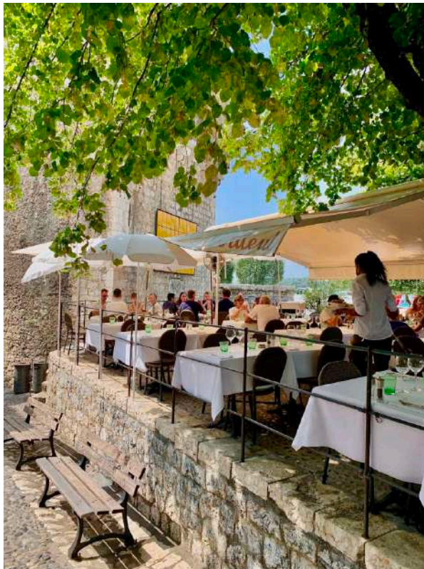
サン・ポール・ド・ヴァンスのレストラン「Le Tilleul」

9:30 a.m. 美味しい朝食の後、フランスの田園地帯をドライブし、中世の村、サン・ポール・ド・ヴァンスへ。1:00 p.m. レストラン "Le Tilleul" でのおいしい昼食の後、見所を巡るガイド付きウォーキングツアーをお楽しみください。Grand-Hôtel du Cap-Ferrat - A Four Seasons Hotelに戻った後は自由行動となります