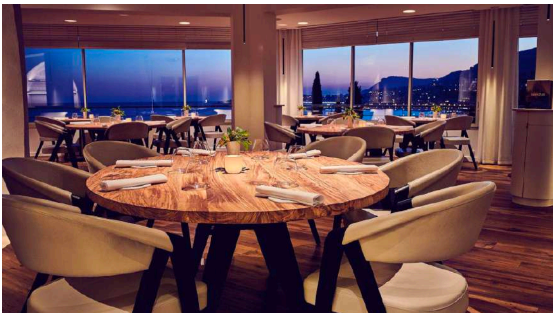
レストラン「Mirazur」からの眺め

1976年にラ・プラタで生まれたアルゼンチン人シェフ、Mauro Colagrecoは、多くの偉人と共に働いた後、独立し、マントンで探し物を見つけました。Mirazurは「イタリアに隣接する最後の家」。多くの訪問者が地中海の格別な眺めに魅了されています。才能あるチームと、超短サプライチェーン（彼のパーマカルチャー菜園）の利点を活かし、円熟みを増しています。月の周期に合わせて、季節や地域を超えて、彼の料理は香り豊かな植物、花、野菜、柑橘系果物への毎日の賛歌です。忘れられない経験を。